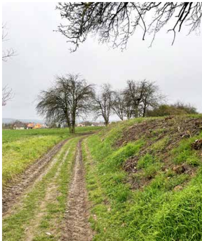
Úvozová cesta do Důní bude na podzim nově osazena

Dalším plánem je obnova polních cest přes široké lány, které by tak byly rozděleny na menší celky, z Bosně na Přestavky a Dobrou Vodu, také z Bosně do Býčiny a staly by se tak bezpečnými komunikacemi pro pěší i cyklisty mimo frekventované silnice. Zkušenost je již z obnovy cesty přes pole z Bosně do Kněžmosta, která byla realizována s pomocí CHKO Český ráj. První společné jednání zástupců obce a města Mn. Hradiště s největším místním zemědělským podnikem AgroVation Kněžmost k.s. se uskutečnilo 26.5.2023. Snahou tohoto velkozemědělce je obhospodařování svých polí velkými stroji pokud možno bez různě klikatých hůře obdělávatelných hranic. Proto pan Horsch navrhl případnou obnovu cest ne v jejich původní poloze, ale podél současných vedení vysokého napětí, která tvoří pro zemědělské stroje už tak překážku. Vzhledem k ochranným pásmům kolem takových vedení by takto budované cesty byly kompromisem. Cesty by byly jednak napřímeny a jednak by stromy podél nich mohly být jen v několika rozšířených místech mimo ochranné pásmo elektrického vedení. Ve zbytku